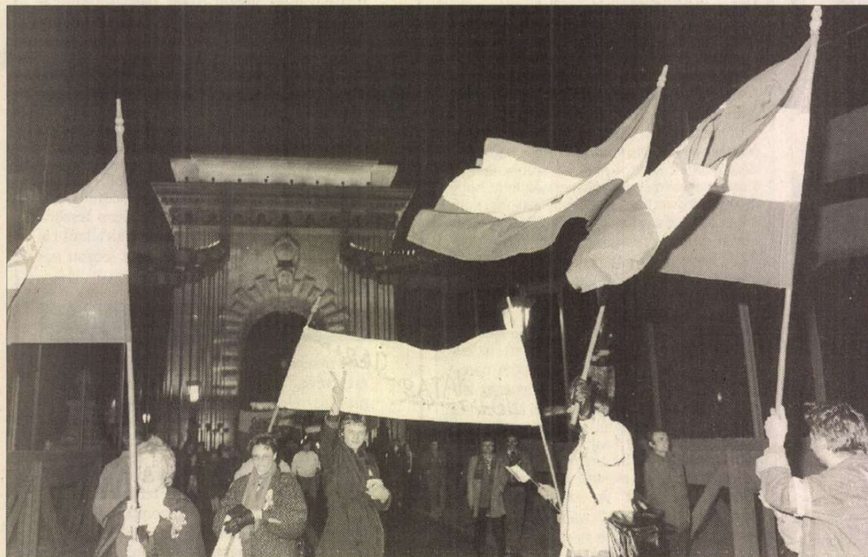
Az akkor alternatívának nevezett szervezetek esti demonstrációja a Lánchídon

Rácz Sándor lelki táviratát hozom el nektek! Szíve, értelme minden melegével, lelke minden rezdülésével együtt ünnepel veletek. Végtelenül sajnálja, hogy nem lehet most itthon. Amerikában igyekszik eleget tenni annak az elkötelezettségnek, amelyet ti már órála ismertek és tudtok. Remélem, hogy ha hazajön, be tud erről nektek számolni. Magam részéről programszerű üzenetét mondom: több pártot az országba, munkástanácsokat a gyárakba!